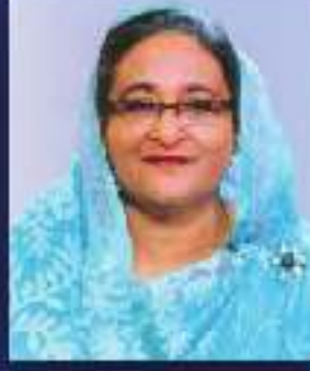
মাননীয় প্রধানমন্ত্রী শেখ হাসিনা, এমপি