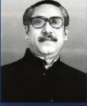
জ্ঞাতির জনক বঙ্গবন্ধু শেখ মুজিবুর রহমান