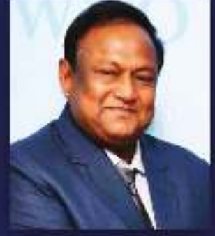
মাননীয় মন্ত্রী, বাণিজ্য মন্ত্রণালয় টিপু মুনিশ, এমপি